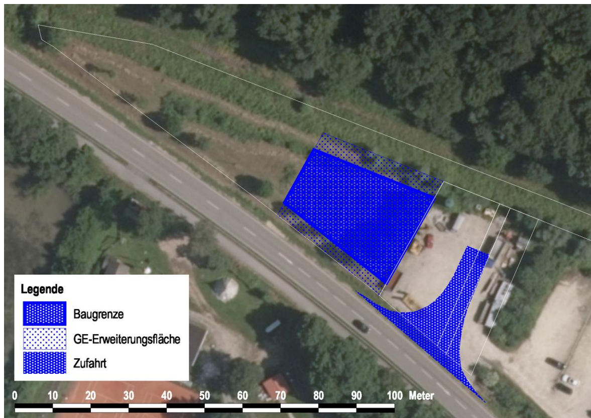
Abb. 2: Luftbild mit Darstellung der Planung (Maßstab 1 : 1.000)

Eine detaillierte Planung zur Bebauung mit Gebäuden liegt noch nicht vor. Geplant sind voraussichtlich zwei Hallen, eine auf der derzeitigen Ausgleichsfläche und eine auf einer aktuell befestigten und als Stellplatz genutzten Fläche im bestehenden Gewerbegebiet. Außerdem muss eine neue Zufahrt von der Bundesstraße aus gebaut werden.